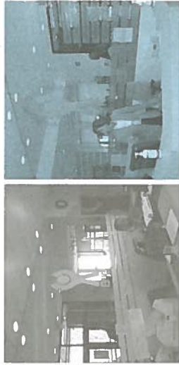
Rajeunissement de l'accueil