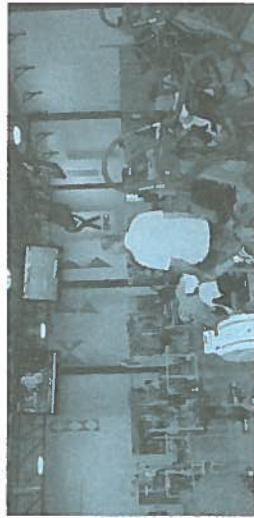
Renouvellement des appareils et écrans plasma