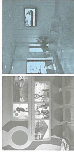
Nouveau décor de la salle d'attente